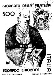
(イタリア 1988 年発行)