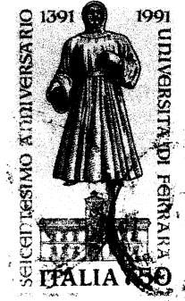
(創設者エステ家のアルベルトV世と大学)

このほか、さまざまな時代の文人や芸術家に関する切手として「(詩人)レオパルディ生誕 200年【1998】」「ミケランジェロ没後 400年【1964】」「レオナルド・ダ・ヴィンチ生誕 500年【1952】」「(作家)ボッカッチョ没後 600年【1975】」「ダンテ生誕 700年【1965】(下図左)」「(詩人)ウェルギリウス生誕 2000年【1930】(下図右)」「(弁論家・政治家)キケロー没後 2000年【1957】」などがある。