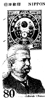
(日本 1994 年発行)