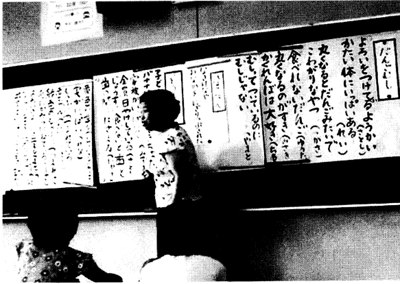
写真2 だんご虫~とうもろこし 板書

「バナナにアトピーできちゃった」と「もうふにつつまれ」と「緑の毛布につつまれた……」この2人合わせると「ぴったりかんかん賞」だね。 ↓ダンゴムシの詩はどちらかというと視覚的なものが多いように思いました。トウモロコシで選ばれた作品は「アトピー。」も「もうふにつつまれて。」も、自分自身の体感としての皮膚感覚が浮かんできたように思えます。