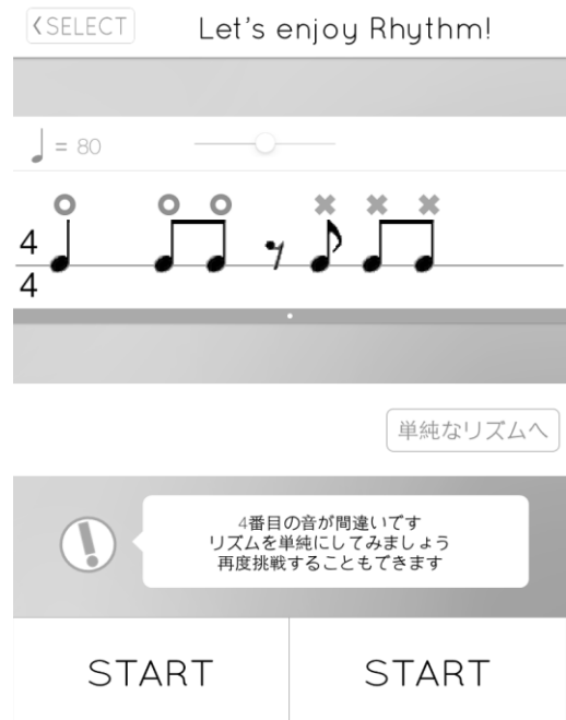
図 1 システム画面 Fig. 1 System interface.

図 1 は本研究で用いているリズム課題の演習システムである Rhythm Tour の画面例である。本システムは iPhone/iPad 向けのアプリとして開発されている。システムを利用した演習の流れを図 2 に示す。学習者