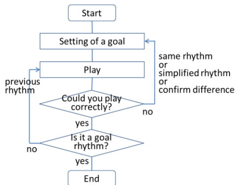
図2 演習のフロー Fig.2 Exercise flow.

は、まず、幾つか提示される目標課題候補から、一つを目標課題（つまり、演奏するリズム譜）として選択する。次に、そのリズムを演奏する。演奏は画面下部に表示されるボタンをタッチすることで行い、タッチの際にはスネアドラムの音が鳴る。システムはその演奏がリズム譜に沿っているかどうかを診断し、その結果を表示する。図1はこの診断結果の表示画面となっており、適切に演奏できなかった音符に×印がつけられている。一つでも×印があればそのリズム課題の演奏は失敗したとみなされる。演奏に失敗した場合で支援機能を用いない場合（支援機能 OFF）には、再度その課題を演奏し、成功するまで繰り返す。演奏に成功すれば、再度目標課題を選択する画面に戻る。