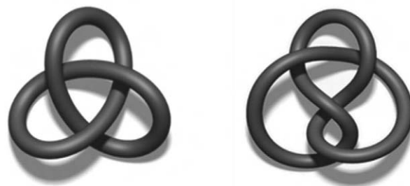
図1: 結び目のイメージ(左は三つ葉結び目, 右は八の字結び目)

基本群は多様体の情報から得られるものであり、結び目そのものには対応しない。結び目と基本群を関連づけるのがデーモン手術という操作である。簡潔に言えば、デーモン手術とは結び目から3次元多様体を作り出す操作のことである。対象論文の研究は、結び目から