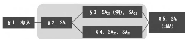
図 3 : 論文の構造

問い（に対応する主張：SAs）に着目して再び論文構成をみると、次のような構造になっていることが分かった。