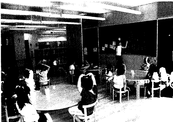
写真1 丸テーブルが並ぶ教室(山梨学院大学附属小)

明治期に兵舎をモデルとして設計され、その後それを踏襲し続けてきた小学校環境。相対的にみて、幼稚園環境が子どもにとって興味深い場所であるのに対して、小学校環境は効果的な教授を目的として構成されていた。「行きたい空間」「学びたい空間」として、幼小の学習空間の構成をどのように見直すか。重要な課題である。