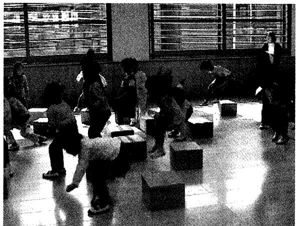
写真4 箱のタワーを数えてみる