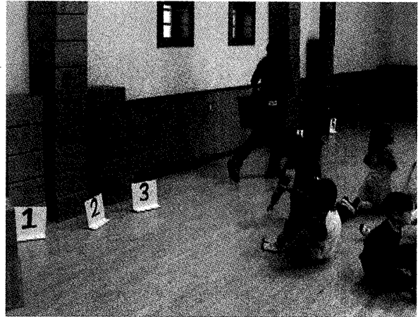
写真3 箱を使った見立て遊び

箱に好きな絵を描く。(3) 「好きな果物は？」 「好きな色は？」などのアンケートを実施。(4) 箱をグループで協力しながら積み重ねてタワーをつくり、数えてみる（写真4）。(5) その結果を模造紙に書き記す（写真5）。以後(3)～(5)を繰り返す。