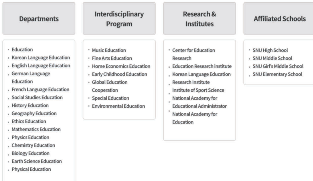
図4 SNU-COEの組織図