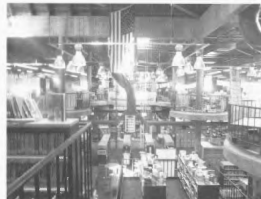
Fig.4 体育館の中にあるようなオープンスペース

1993年に設立されたこの学校は9年生から12年生までが通う小さな大学で、ボストン大学の敷地に隣接し、ボストン大学と連携してカリキュラムを開発している学校である。ボストン大学は倫理・品格教育開発センターを持っているので、それに関するカリキュラムを持っているとのことだった。加えてケンブリッジ地区という、全米でも