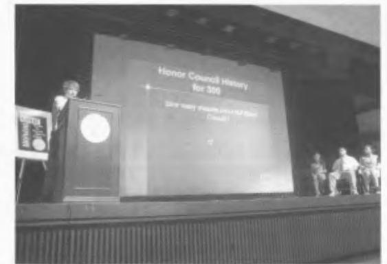
Fig.1 Honor Code (社交の作法)の理解を広める全体集会

倫理教育ハンドブックによると、高学年になると、品格徳目について、より深く理解することが求められるだけでなく、学校での日々の生活の中で学校というコミュニティを豊かにするリーダーシップを発揮することが求められる、とある。このカウンセラーの仕事も、コミュニティを豊かに