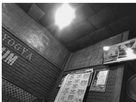
図2 屋台内に設置されているテレビ

ノンクロン③は地元市場の近辺にある屋台Cで観察したノンクロンだ。この屋台Cにはテレビが設置されていて、ニュース番組をずっと放映している。付近の屋台には似たような光景が広がっていて、どの屋台でもテレビでニュースを見ることができる。市場に近いこともあって、屋台Cを含め付近の屋台は朝の買い出しや品卸しをおえた人々の朝食や、休憩としてにぎわっていた。親子で買い出しに来たC-1、C-2は店主C-3とバイクタクシーアプリGojekのドライバーの運転が荒く、事故の危険性もあるし、渋滞の原因にもなっているから、法規制してほしいねと話しながら料理を待っていた。市場での買い物があまり芳しくなかったようで、食料品の値上がり、特に鶏卵の価格がひと月で2倍になったことに憤慨していた。C-1が、母親であるC-2に価格高騰の原因を尋ねると、C-2はガソリン価格のつり上げに原因があるとしていて、その時ちよ