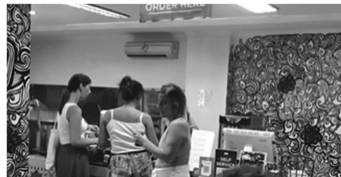
図1 カフェ内装の様子

ステータスとなっている(B-1)。B-1はカフェや近辺の商業施設、観光地に外国人観光客が多数訪れるようになったことに触れながら、緩和されつつあるインドネシアのコロナパンデミック水際対策について、ロックダウンは長く実施し、学校の閉鎖も長引いたし、いまでもマスクの着用やワクチン接種証明の形態が義務付けられていて、国際水準よりも厳格な体制だったのに、海外からの観光客はほかの国が往来を始めた途端に解禁してアンバランスだと話した。さらにスマートフォンでネットニュースやSNSで情報を探しながら、外国人観光客受け入れ拡大の方針を立てた現大統領が近日中にほかの国の首脳と会合している様子から、大統領が国民に対しても、対外的にもパフォーマンス重視で、実態が伴っていないとした。B-2はそれをききながら、近年観光客の減少により再開発された商業地区の店の売れ行きが悪くなっていることを話しながら、訪れる人が増えて、お土産を購入する人が増えないとジョグジャカルタもインドネシアも立ちいかなくなっていくと話し、感染者が増えたら対策を強化し、落ち着いたら弱める、を繰り返すしかないと話していた。B-1はそういった対策の強化、緩和の繰り返しの必要性はわかっているが、現大統領は世論へのパフォーマンス、対外的な他国へのパフォーマンスでころころと態度を変えすぎているとし、一度は国際的な流れに乗ろうとしてLGBTQ等性的マイノリティに対して融和的な政策を打ち出した