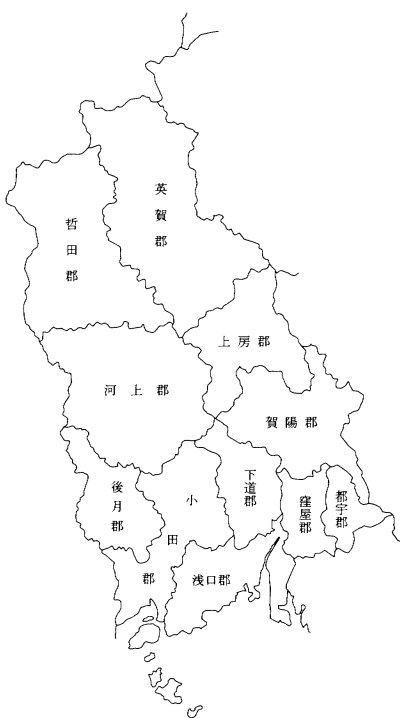
図版2 備中国旧郡略図

三は、一門口羽通良の系譜に連なる口羽善九郎(通平)が英賀郡、口羽十郎兵衛(元良)が河上郡・英賀郡に給地をもつことである。天正四年八月二十三日に毛利輝元は口羽春良に河上郡の国吉城領所一〇〇貫を申付け、在番を堅固に勤めているとし、河上郡手之荘七〇〇貫、中津井内三〇〇貫を給与している(中津井は北房町。近世までは英賀郡に属す)。そして口羽春良・元良父子は成羽氏 (29) がこの地域の領主層と緊密な関係を取り結んでいた (30) 。