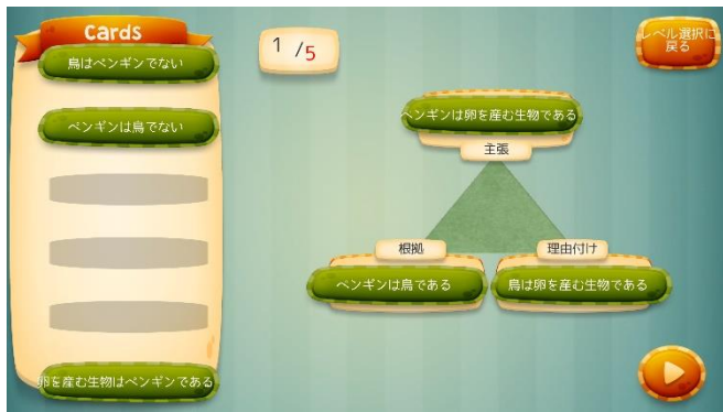
図1 三角ロジックの組立例（常識問題）