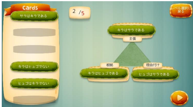
図2 三角ロジックの組立例（無意味問題）