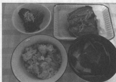
図2 和食の調理実習 完成の献立