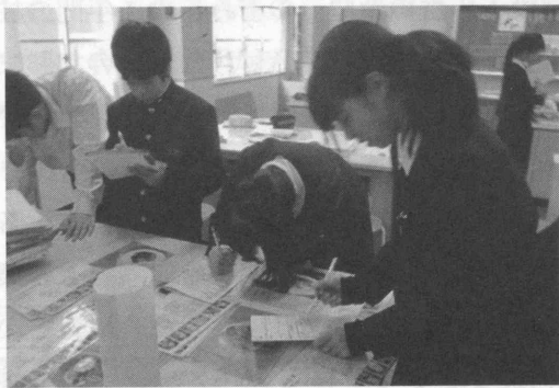
図3 料理の本や先輩の献立を参考にする