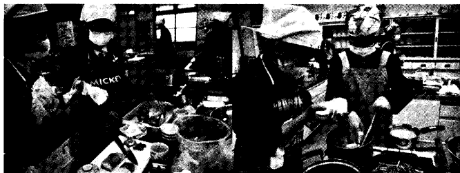
図6 各班で協力して試し作りを行う

図6は、実際に試し作りを行っている場面である。自分の担当料理だけでなく、お互いの料理をフォローしあったりする姿もたくさん見られた。