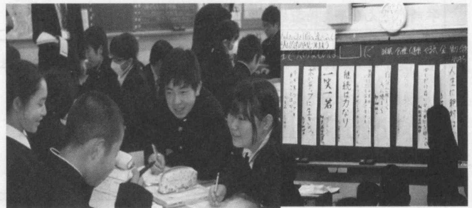
図8 班交流と各班から出た祖父母の人生訓

それは、祖父母の「生きていく上で大切なもの」「こんな人になってほしいという願い」を受けとめ、交流する活動を通じて、人生の大先輩の言葉をこれからの生き方に結びつけて考え「なりたい自分」を心に描き、自己の向上をはかろうとすることを目標とした授業である。家で聴き取ってきたことを交流し図8のように各班から出した10個の人生訓も参考にしながら、自分が大切にしたいことを語り合った。自分の祖父母に聞いたことが土台になり、そして仲間の祖父母の言葉も興味深く考えながら聞いていた。