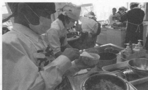
図1 和食の調理実習の場面

各班の人数は4名で、一人一品を担当しながらもお互いで助け合う調理実習をめざした。