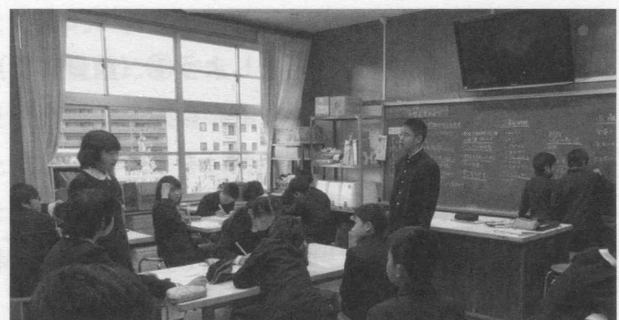
図1 学級での話し合いの様子