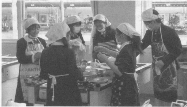
図2 調理グループ実習の様子