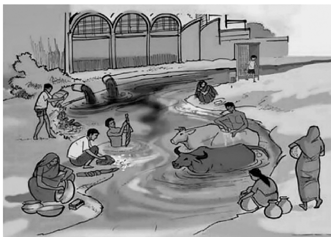
図 2. Bangladesh 国定教科書の 4 年生理科にある川の水質汚染に関する描画

書では川が安全ではない水と紹介されているが、 FGI の対象となったすべての児童でも川を「汚い水」と回答していたのであった。そして、 FGI の対象となった児童からは A 集落の川はゴミの滞留、臭いの発生、水の着色、トイレからの汚水流入により、どのような用途にも使用できないとの意見が聞かれた。本研究では川に関する上記のような児童の知識を確認すべく、図 2 に示した 4 年生理科の教科書の 36 ページ目に掲載されている絵（ NCTB 2015d ）を FGI 時に児童に見せ、絵にある川の水質についての聞き取りを行った。この結果、この単元を学習し終えている 5 年生のみならず、学習前の 3 年生と 4 年生でも図 2 に描かれている川の水質が良好ではないことを指摘した。そして、その理由としては図 2 に描かれている川の上流で工場排水やトイレから汚水が流入し、ゴミの投入、沐浴、食器洗い、牛の洗浄も実施されていることが挙げられた。したがって、児童の水質汚染やその原因についての的確に理解しているのではないかと考えられる。