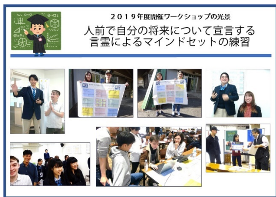
資料 7.3 留学ビジョンの発表光景