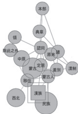
図3 「漢人」(アジア史)の共起ネットワーク(一部)