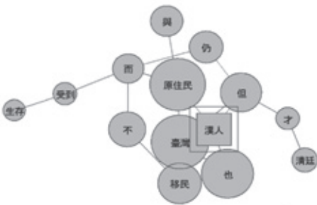
図2 「漢人」(台湾史)の共起ネットワーク(一部)

まず、「台湾史」の教科書を対象に、「漢族」と「漢人」に着目して共起ネットワーク図は作成した。その結果、「漢族」に関するネットワークを形成することができなかった。それは「台湾史」教科書2冊のなかで「漢族」という語がたった1度しか登場していないためである。共起ネットワークは複数の文から語の特徴を探るため、1度しか登場していない語ではネットワークを形成することはできない。なお、その1回は龍騰文化出版教科書の「ただし『蕃』という呼称には、漢族中心の思想や文化差別的な意味合いが強く含まれている(但「番」的称呼，帶有濃厚的漢族中心本位思想与文化歧視的意味。)」(下線は筆者)という文中で使用されており、これは清朝統治期の原住民族の呼称についての記述である。