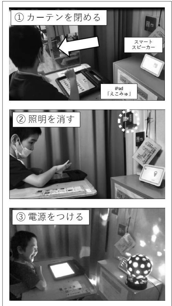
Fig. 3 生活家電を操作する様子

これらのことから生活家電などの操作や余暇での利用をスマートスピーカーで行うことによって自己有用感の醸成や、好きなものを早く調べたりできるなど、児童にとって有効なツールである事がわかった。