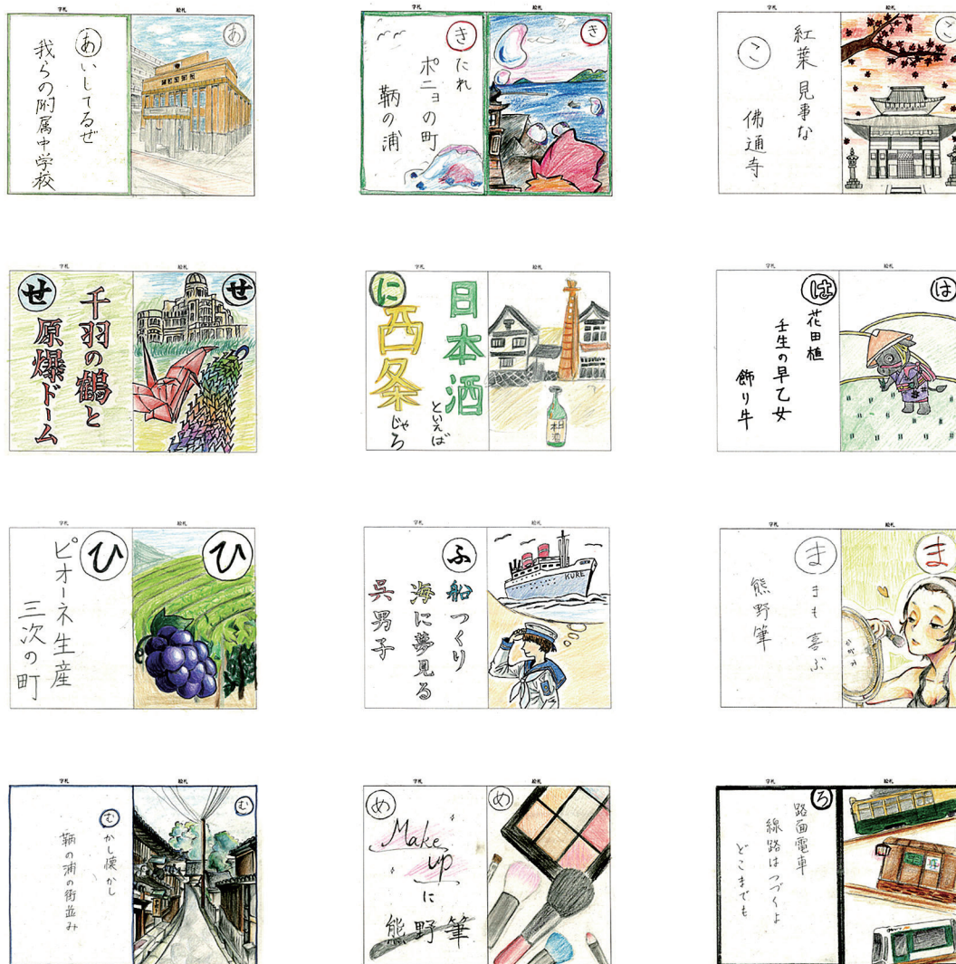
図3 生徒の選んだかるた札 (一部)