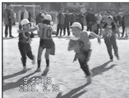
図1 赤チームの最後の攻撃でのタッチダウン

課題とされた子どものプレーは、紫チーム対赤チームのフラッグ・フットボールの試合中の出来事であった。赤チームが図1にあるように、この前の攻撃でタッチダウンしたが赤チームの攻撃はこれで終了した。得点は8対7で紫チームがわずかにリードしていた。防御の赤チームがこの試合に逆転するためには、相手の次の攻撃でクォーターバックを押し込みスタートラインより後方でフラッグを取る攻撃しか残されていなかった。