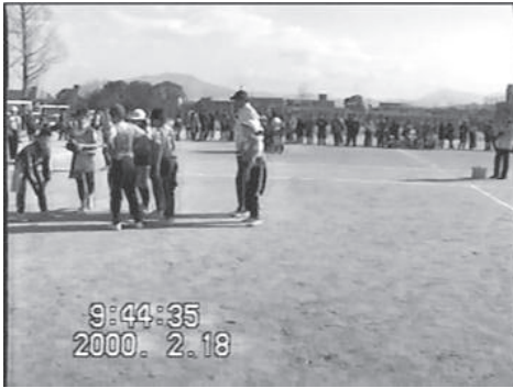
図2 紫チームがわざと失敗する作戦を提案

ここで、紫チームはわざとゲーム開始の後方への味方パスを失敗して攻撃を終了する作戦を提案した。図2のように、赤チームは「卑怯だ」と猛烈に抗議し、そのために試合が止まったので、教師が話し合いに介入した。教師は、「正々堂々とプレーしよう」と指示し、紫チームのわざと失敗する作戦を認めず、攻撃するよう指示した。紫チームは教師の指示に従い、最後の攻撃を行い得点はできなかったが、8対7で紫チームがこの試合に勝利した。