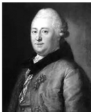
肖像画 Christian Felix Weiße (1726-1804) 10