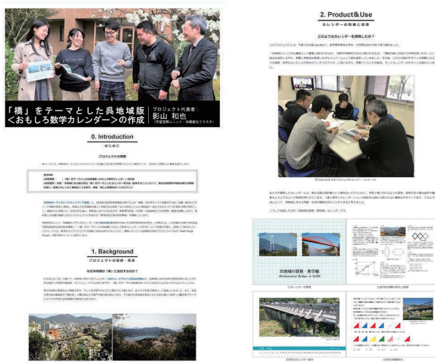
図4 「おもしろ数学カレンダープロジェクト」のページ(抜粋)

第3に、「社会貢献」を紹介するページを開発した(図4)。カリキュラム,教科書,教材,専門家養成プログラムなどのデザインを通して新たな教育・社会環境を創出していくプロセスを,研究主題との関わりも意識して簡潔に再現した。