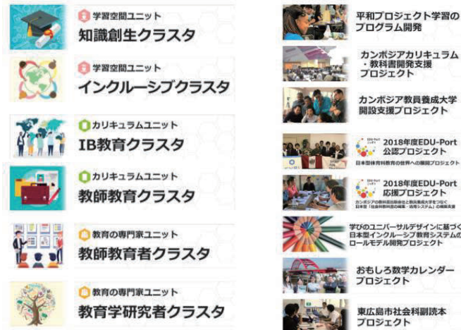
図 2 個別ページに誘導するバナー

具体的には、第 1 に、「研究活動」と「社会貢献」のホームページに誘導するゲートウェイを開発した（図 2）。本ページは、その性格から「R & D」と称する。ここには、EVRI の研究組織（3つのユニット・6つのクラスタ）に対応させて、研究の目的・対象をロゴで表象したバナーを設置した。また、外部資金を得てプロジェクトベースで展開している 8 つの社会貢献についても、活動の様子の写真で示したバナーを設置した。