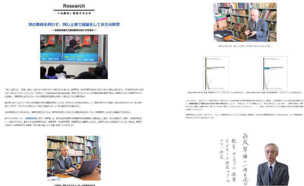
図 3 「IB教育」研究クラスターのページ（抜粋）

第 2 に、「研究活動」を紹介するホームページを開発した（図 3）。主に研究代表者への聞き取りを通して、研究の端緒と経緯、成果物および論文等を、語り口調で再現した。また、ユニット代表者が掲げる研究上のヴィジョン＝志を手書きで表現いただいた。