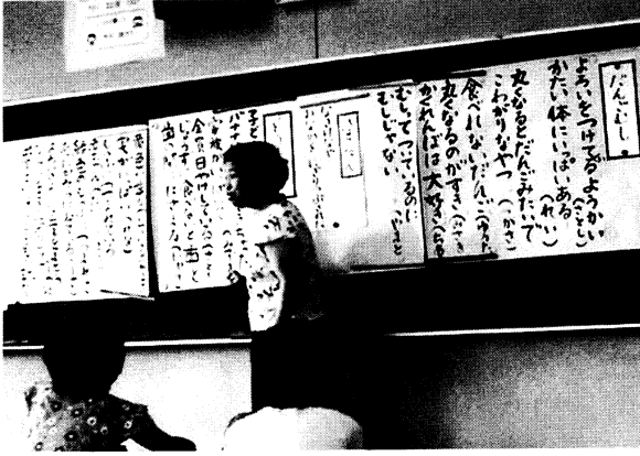
写真2 だんご虫~とうもろこし 板書

「バナナにアトピーできちゃった」と「もうふにつつまれ」と「緑の毛布につつまれた……」この2人合わせると「ぴったりかんかん賞」だね。 ↓ダンゴムシの詩はどちらかというと視覚的なものが多いように思いました。トウモロコシで選ばれた作品は「アトピー。」も「もうふにつつまれて。」も、自分自身の体感としての皮膚感覚が浮かんできたように思えます。