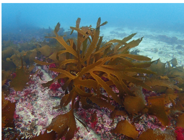
図3 大型褐藻アラメの林床に生育する無節サンゴモ。