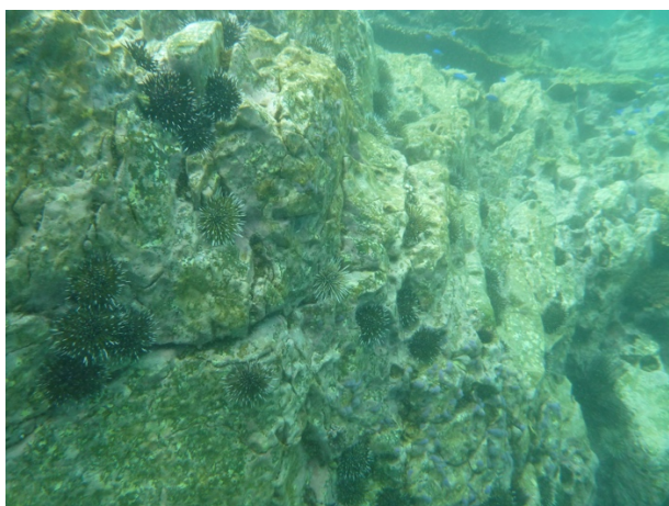
図2 磯焼けの海底。ほぼ無節サンゴモのみが見られる。