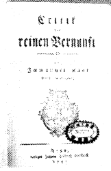
左：小牧治『人と思想 カント』清水書院、1967年 右：カント『純粋理性批判Kritik der reinen Vernunft』 1781年の初版本(広島大学西洋哲学研究室所蔵)

浸透し、国民性を形成する大きな要素となっていた。しかし、それらは、維新後顕著となる三つの思想的傾向によって大きな比重の変化を強いられることになる。