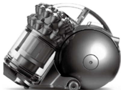
図1：ダイソンエンジニアリングボックスの掃除機モデル