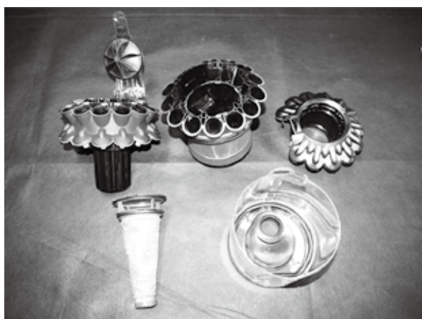
図2：サイクロンパートの部品

のクリアビン、微細なゴミを遠心力の力で確実に収集するための部品やボディパート内へのゴミの混入を防ぐためのフィルタで構成されている。ここでは、工具を使った分解作業は必要ないため簡単に作業できる。