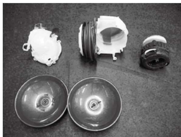
図3：ボディパートの部品

授業の導入部分では、サイクロン式掃除機生まれた経緯を知らせる。また、分解する製品モデルのもととなる市販の掃除機を実際に使用させることで、ゴミが吸い込まれる仕組みを考えるためのイメージ