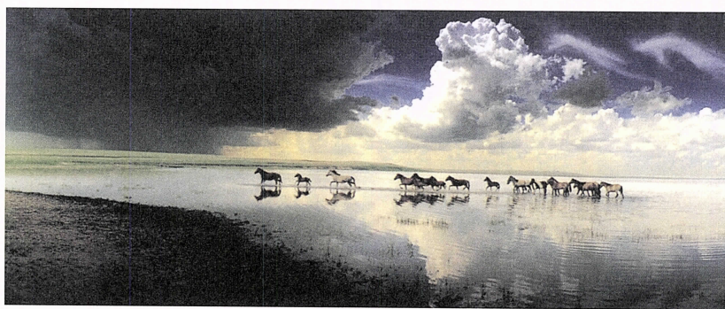
写真3 「風雨の兆し」胡鑛彬（中国） 27.5×10.8cm

このN・H君は美しいとも、感動したとも 書いていません。写真を見ていかに自分が揺 すぶられたかと言うようなことは少しも書こ