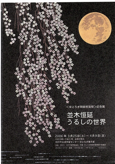
写真4 「月昇」21×29.6cm 並木恒延個展パンフレットより

子ども時代を振り返ってみれば、誰にでも思い当たることがあるはずで、故郷の家でのこと、庭先にいながら、向こうに見える山