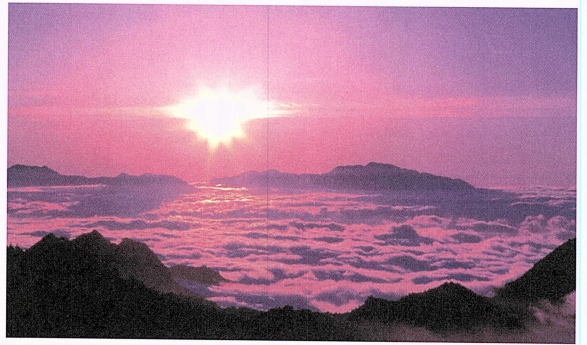
写真5 朝日岳より大雪山系 朝日を望む 51.3×30.2cm

もう太陽が空高く上っている。だんだん空が明るくなってきた。「今、何時かなあ?」と思って空を見上げる。「7時ぐらいだ。」光のぼしよで分かった。朝日はきれいだ。山の上でぼくは見ている。夜のうちに山を歩いたから昆虫さいしゅうのカブト虫は見つけど、まだぬい。