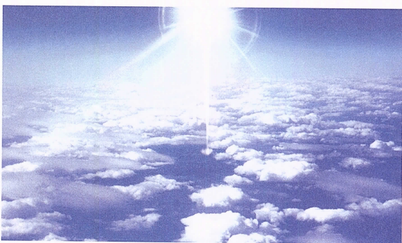
写真2 太平洋上空 機上より 51.3×30.2cm

こちらは真昼の雲海の向こうから届く白い光です。前者と同じように素直な感動をこの子も書き留めています。素直と言いました。神の光ということばで感動の大きさ深さを喩えているのではないでしょう。ただ、こ