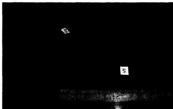
図1 実験No. 5の結晶