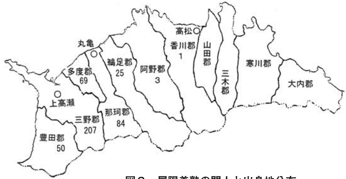
図2 屏陽義塾の門人と出身地分布

のそれは、西讃地域を中心とする四国地方にほぼ限られていた。咸宜園は九州を中心として全国から入門者を集めたが、その系譜塾である屏陽義塾は地域限定的な漢学塾であったといえよう。もともと、咸宜園が全国から入門者を集めたのは幕末期までのことであって、明治中期になると大分県を中心とする北部九州に偏らざるを得なかった。