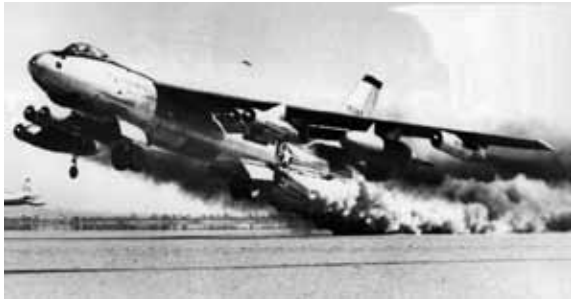
写真 3 B-47 17

さらに、後退翼とジェットエンジンを装備した B-52 が開発された。8 基のジェットエンジンで、最大搭載量が約 20 t の B-52 は、1952 年に初飛行を行い、1955 年に SAC による運用が開始されている。B-52 は、2016 年現在でも、現役の戦略爆撃機として配備されている 18 。写真 4 に、B-52 を示す。