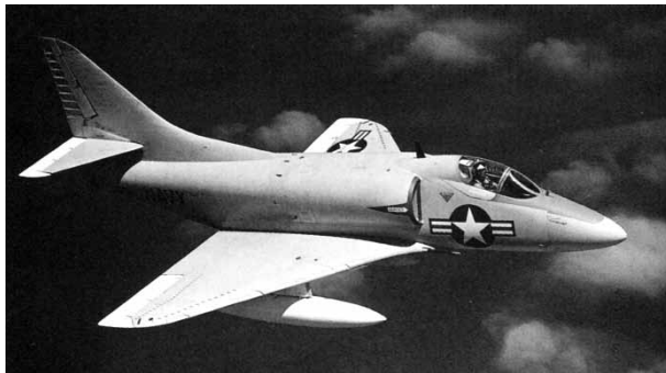
写真 9 A-4 38

において、アメリカ海軍空母タイコンデロガ (Ticonderoga) のエレベーターから、攻撃機 A-4E スカイホーク (Skyhawk) が海中に転落した 37 。A-4E には、B-43 核爆弾が 1 発搭載されており、乗員 1 名と共に、5,000 m の海底に沈んだ。写真 9 に、A-4 を示す。