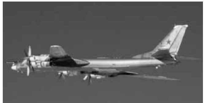
写真 6 Tu-95 24 。

さらに、ターボプロップエンジンを 4 基備え、最大 15 t の爆弾を搭載できる Tu-95 も、1952 年に初飛行を行った。Tu-95 の航続距離は 13,000 km であり、仮想敵国であるアメリカ合衆国本土まで侵入し、原子爆弾を投下して帰投できるだけの能力を備えていた。写真 6 に、Tu-95 を示す。