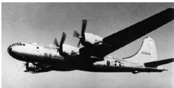
写真 1 B-29 8

アメリカ陸軍航空軍は、原子爆弾の重量である 5 t 以上の搭載量を持つ重爆撃機として、B-17、B-24、B-29、B-32 を保有していた。その中で、搭載量が最も多い 31.6 t である B-29 が、原子爆弾を運搬する手段として選ばれた。問題は、シンマンの全長が、B-29 の爆弾倉より大きいため、機内に原子爆弾を搭載できないということであった。写真 1 に、B-29 を示す。