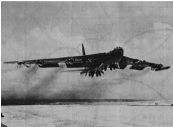
写真 4 B-52 19

さらに、後退翼とジェットエンジンを装備した B-52 が開発された。8 基のジェットエンジンで、最大搭載量が約 20 t の B-52 は、1952 年に初飛行を行い、1955 年に SAC による運用が開始されている。B-52 は、2016 年現在でも、現役の戦略爆撃機として配備されている 18 。写真 4 に、B-52 を示す。