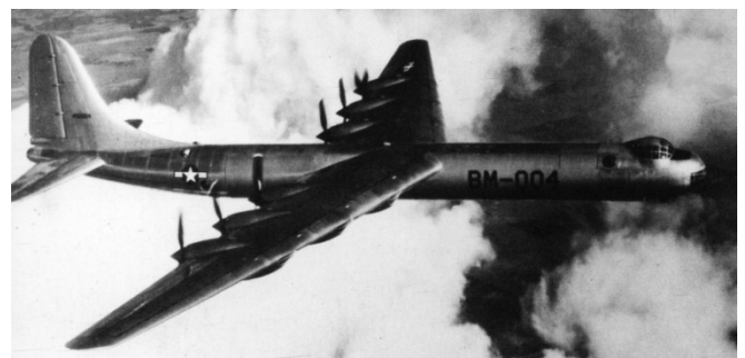
写真 2 B-36 15

アメリカ空軍の SAC は、ソビエト連邦に、原子爆弾 PDC-1 と、その運搬手段である戦略爆撃機 Tu-4 を開発され、核兵器による優位性を確保するために、新たな戦略爆撃機の獲得に邁進した。まず、B-36 が開発された。レシプロエンジン 6 基、ジェットエンジン 4 基を備え、36t の爆弾を搭載できる B-36 は、10,945 km を飛行することができ、原子爆弾を複数搭載し、仮想敵国であるソビエト連邦に深く侵入することが可能であった。そのため、SAC における核戦略を担う主力爆撃機となった 14 。写真 2 に、B-36 を示す。