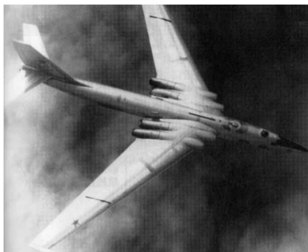
写真 7 M-4 27

(Tsushinskaya) 航空ショーにおいて、Tu-95 が 7 機、編隊飛行を行った 26 。写真 7 に、M-4 を示す。