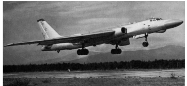
写真 5 Tu-16 23

また、Tu-16 も、1952 年に初飛行をした戦略爆撃機である。最大 9 t の爆弾を搭載でき、5,925 km の距離を飛行することができた 22 。写真 5 に、Tu-16 を示す。