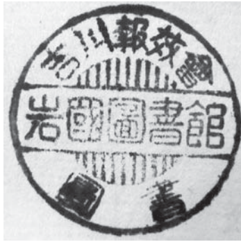
吉川報效会 岩国図書館 図書