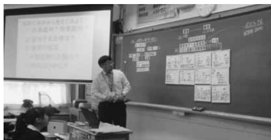
図 4 授業時の板書

⑤ 生徒はまず、自分の考えをワークシート（図 1）に記述し、その後、班の中で意見交流を行い、班で出た意見と生徒の判断結果をホワイトボードに記入して、黒板掲示した（図 4 参照）。生徒の判断結果は以下の通りである。