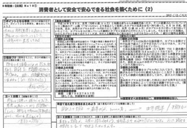
図1 生徒のワークシート