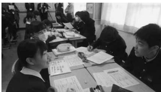
図 5 話し合う生徒