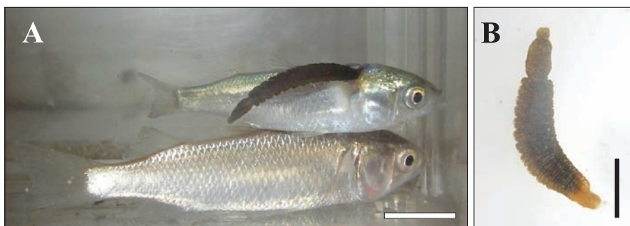
Fig. 1. Limnotrachelobdella okae on young flathead grey mullet Mugil cephalus . A. one (top) of the two fish infested by L. okae ; B. a specimen of L. okae taken from the fish. The two fish were caught in the brackish-water estuary near the mouth of the Nabeta River in Kiso-Misaki Town, Mie Prefecture, on 3 June 2007. Scale bars: 10 mm in A; 5 mm in B.

わが国でヒダビルの宿主として認められている魚類は以下の5目6科13種1亜種で、これまでボラは含まれていなかった：コイ目コイ科のマルタ Tribolodon brandtii （長澤ら, 2008）、ウグイ Tribolodon hakonensis （Nakano and Ito, 2011）；サケ目サケ科のイトウ Hucho peryyi （Furiness et al. , 2007）、サクラマス Oncorhynchus masou