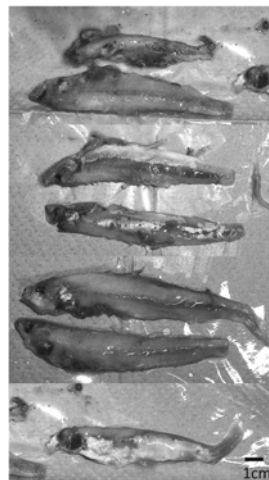
Fig. 2. Juvenile ayu, Plecoglossus altivelis altivelis from the stomach of Japanese seabass.