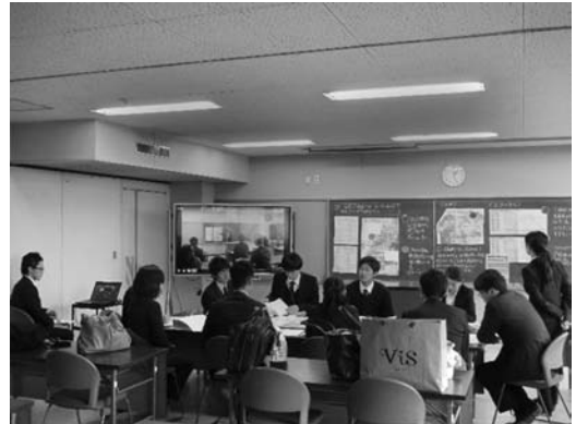
図7 事後協議の様子②