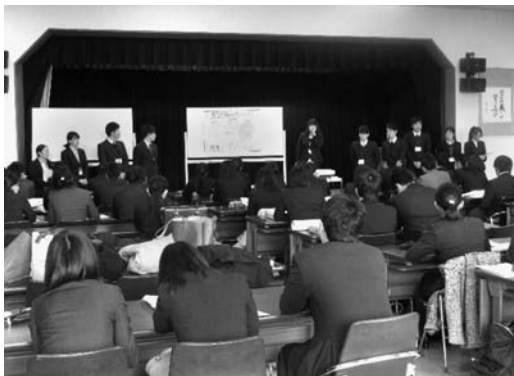
図10 1年間の研究のまとめ②

議の際に使用する、タブレット端末などのICTをより充実させている(図11, 図12)。