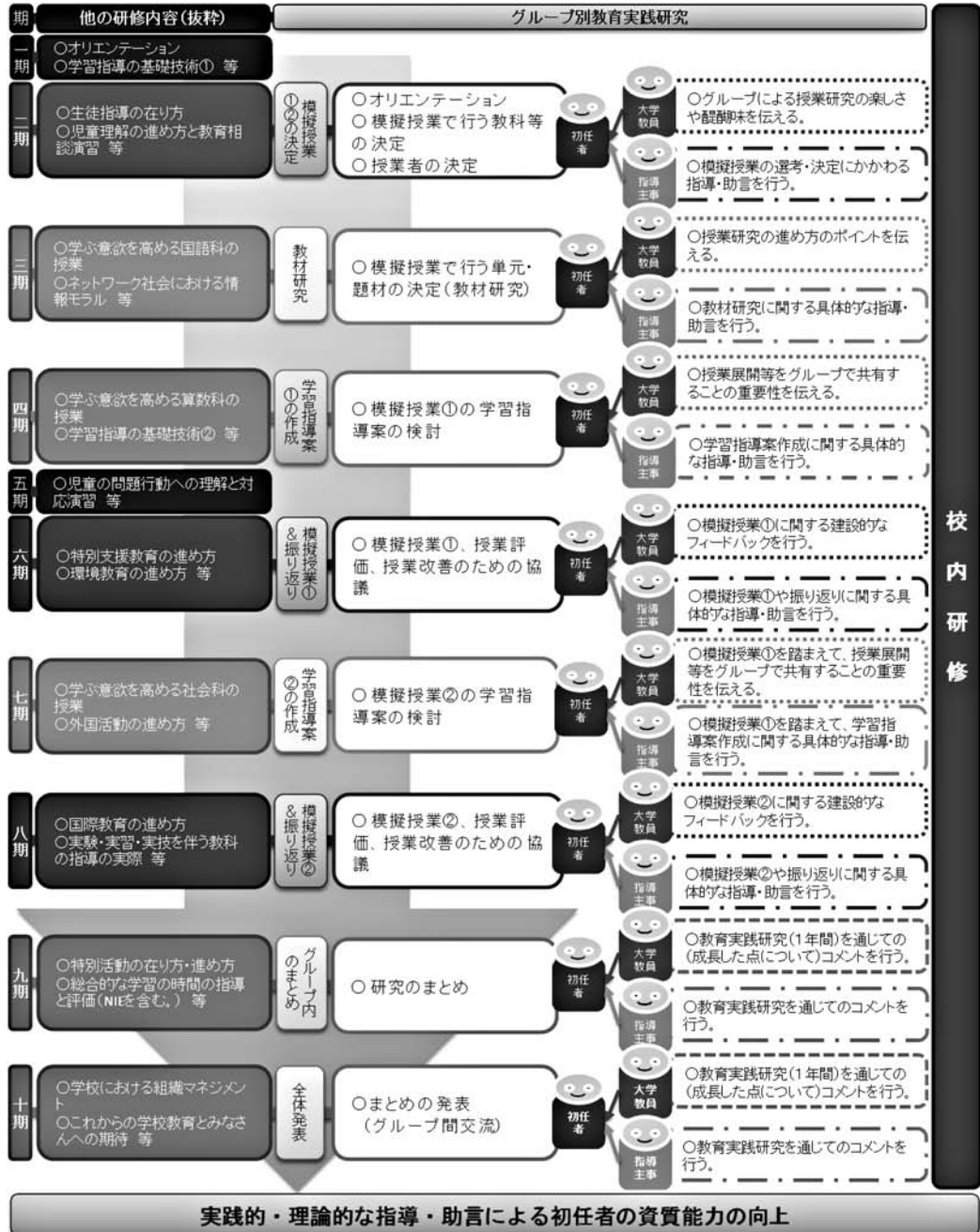
図 2 平成 26 年度グループ別教育実践研究の実施例