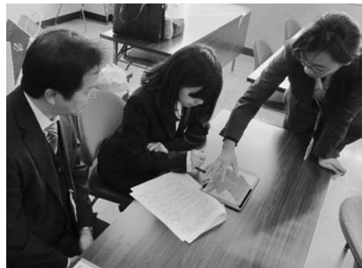
図12 タブレット端末を利用した指導・助言の様子