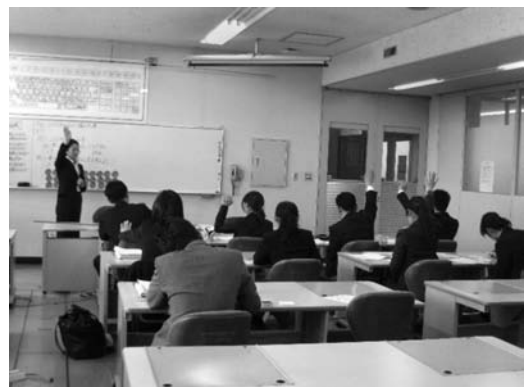
図8 模擬授業Ⅱの様子

グループ別教育実践研究⑤ ：2回目の模擬授業（模擬授業Ⅱ）の学習指導案を持ち寄り，それらを検討する中で模擬授業Ⅱの学習指導案を作成した。模擬授業Ⅱの指導内容・方法の方向性を，模擬授業テーマと模擬授業Ⅰの改善点に沿った形で明確にさせるため，指導主事は模擬授業Ⅱの学習指導案作成に係わる指導・助言を行い，大学教員は授業研究をグループで行う際の進め方や，学習指導案の内容・書き方のポイント等について助言を行った。その際，模擬授業Ⅰを実施したことによって得られた，授業改善につながる視点やアイデアなどに焦点を当てるよう促すような指導・助言を中心とした。