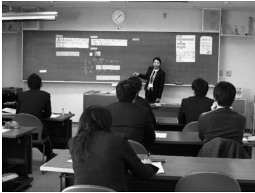
図5 模擬授業Ⅰの様子