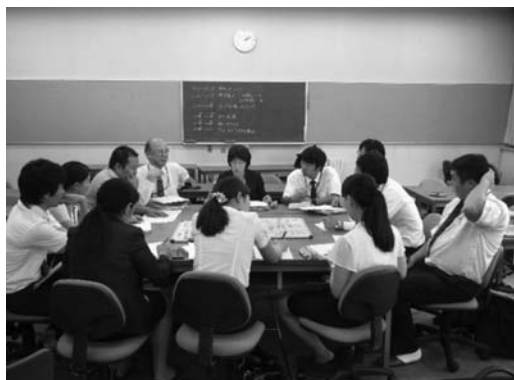
図4 グループ協議の様子