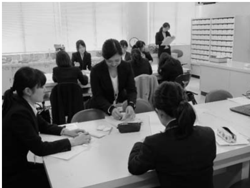
図6 事後協議の様子①