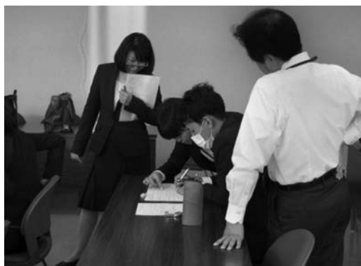
図3 チーム・ティーチングの様子

グループ別教育実践研究④： 模擬授業Ⅰを45分間で実施した（図5）。その後、映像記録をもとに、授業の振り返り・事後協議を行った（図6）。模擬授業Ⅰを実施した後、テーマを観点としながら授業の振り返りを行った。そこでは、授業の改善点を明確化させるために、指導主事は模擬授業Ⅰの振り返り・事後協議における助言・指導を行った。大学教員は模擬授業Ⅰをビデオ撮影し、振り返り・事後協議において、初任者が授業改善をしようとしていることへの肯定的な評価、建設的なフィードバックを提供した。事後協議ではノートパソコンとプロジェクター等を利用して、模擬授業の映像をその場で再生し、初任者・指導主事・大学教員が一緒になって振り返りを行った（図7）。