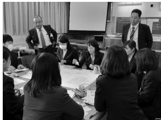
図11 平成27年度の取り組みの様子

《同じ悩みを持っていることがわかり、悩み解消への手立てをいっしょに考えることができた。》