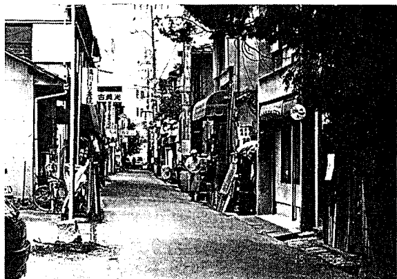
再開発以前の段原（北部、比治山蟹線に出る道）

段原地区は、市中心部から南東へ約2km、JR広島駅から南へ約1kmの位置にあります。原爆投下時には、この地区の西側にある比治山の蔭となり、致命的な破壊から免れることができました。その反面、戦後の復興事業から取り残されたため、いろいろな問題が持ち上がりました。道路が狭く、救急車や消防車が通行できなくて困ることも多かったです。下水道管は地下に埋設されていなかったため、カ、ハエ、悪臭など、衛生上の問題もありました。また、若者たちが古く雑然とした段原に住みたくなくなること、活気のない地区になりました。