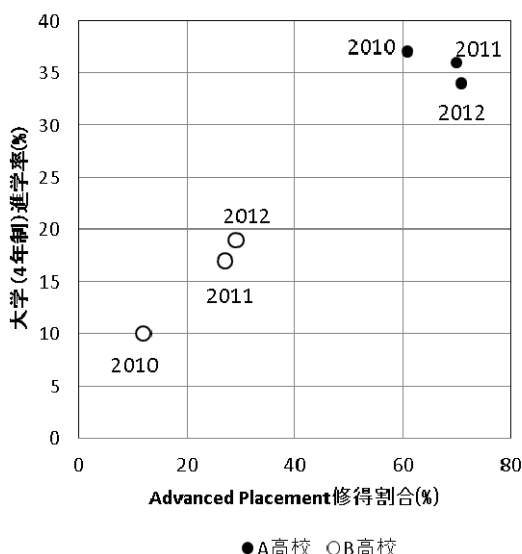
図2 AP 修得状況と大学進学率の関係。図中の値はデータ年度を示す。

では、AP 修得状況に大きな相違がみられるが、図からは、全体で見ればより高い AP 修得率ほど高い大学進学率になっており、AP 修得が大学進学を促していると考えられる。