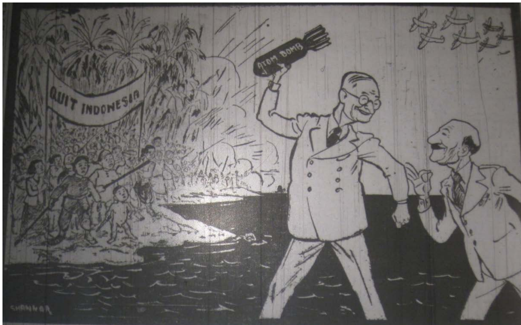
図一2 当時のインドの新聞の風刺画（「インドネシアから出て行け」のプラカードを掲げる民衆に向けて原子爆弾をかざすトルーマン大統領）（ The Hindustan Times , December 8, 1945.）