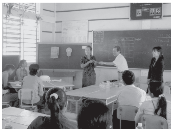
写真5 研修会の様子

乾電池と豆電球を使う実験は、小学校段階で最もポピュラーなものになっている。しかし、これには多くの乾電池を消耗させてしまい、省エネルギーや環境保全の観点からも、勧められない。そこで、筆者は大