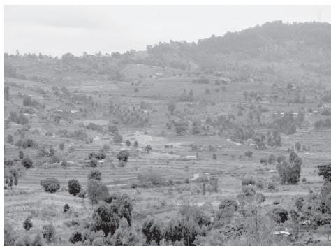
調査のンボオニ地区 (左) と世帯調査で訪れた家 (右)

本調査は、ケニアのマクエニ県でも西寄りに位置するンボオニ地区で、無償化政策導入前後の 2007 年と 2008 年に、初等修了者を追跡することで行われた。ンボオニ地区は、首都ナイロビから南東方向へ車で 3～4 時間ぐらいの山間にある村落地域である。半乾燥地帯ではあるが、標高約 1000 メートル前後の高所に位置しているため、同県