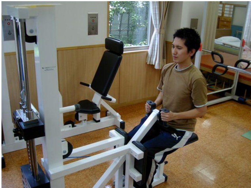
図 3-4. ローイング