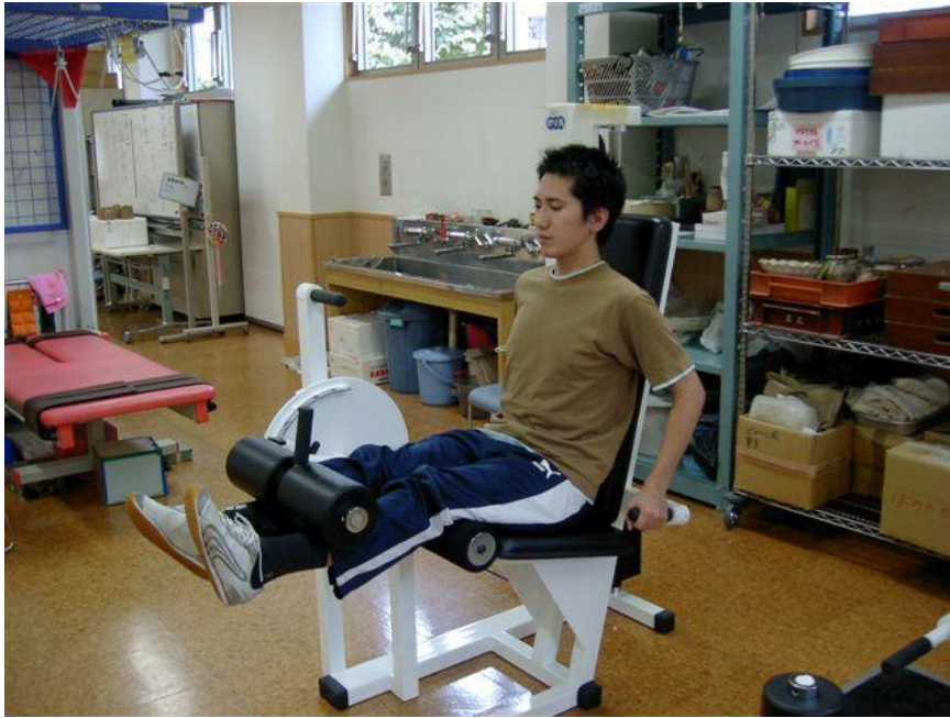
図 3-1. レッグプレス