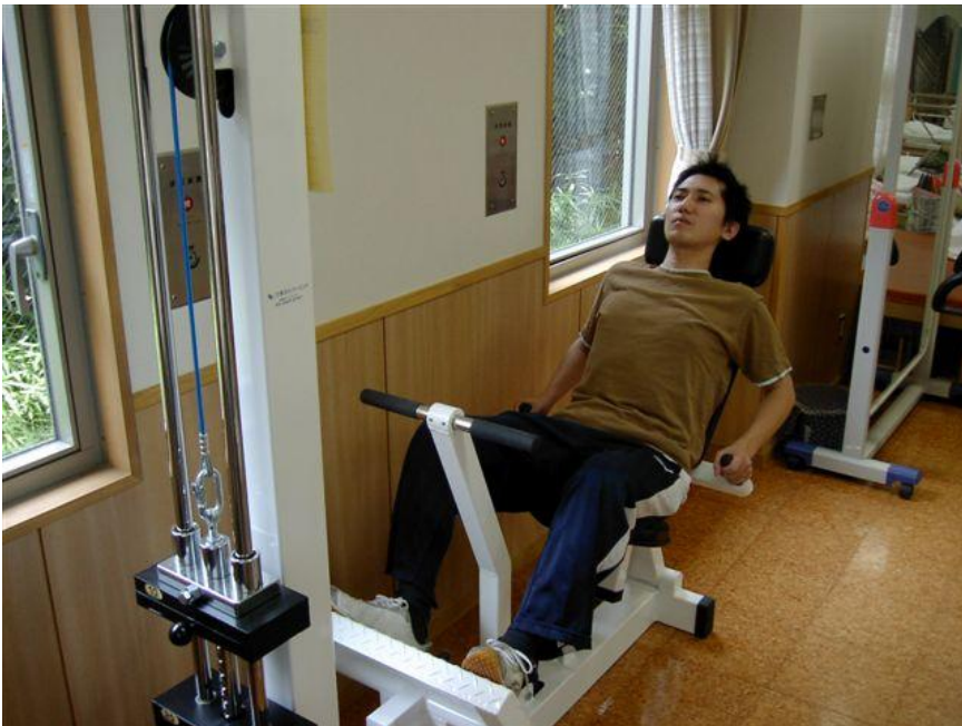
図 3-2. レッグエクステンション