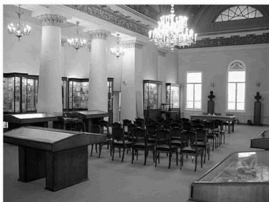
図-2 カザン国立大学本棟旧舞台・体育館ホール （現、大学史記念館主展示ホール：筆者撮影）