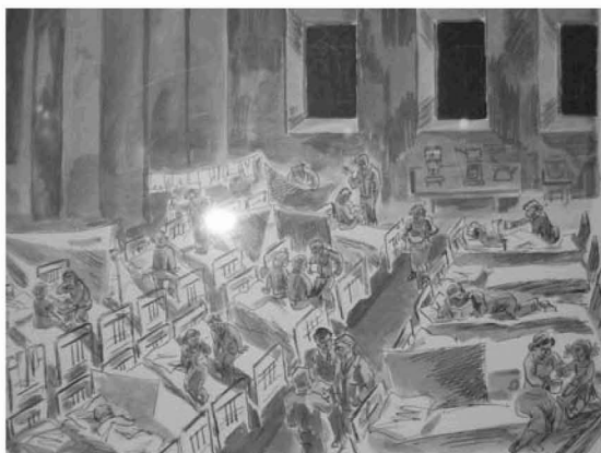
図-3 フレンケリのスケッチから （カザン国立大学・大学史記念館展示品を筆者が接写）