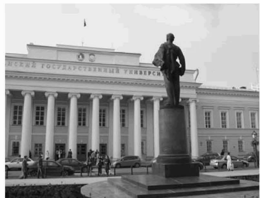
図－1 カザン国立大学本棟

傘下研究所が所在していた (4) 。疎開を比較的早期に 実施し、封鎖の被害が少なくすんだ研究所にはレ ニングラード物理工学研究所と化学物理学研究所が ある。この両研究所については、1941 年 7 月 6 日付 で科学アカデミー副総裁シュミットが副首相コスイ ギン（А.Н. Косыгин：1904—1980。1964—1980、ソ 連邦首相）宛てに書簡を送り、特別の配慮をもって 早期にレニングラードを脱出できるように懇請して いた (5) 。この懇請は功を奏したらしく、物理工学研 究について見れば、8 月 3 日に疎開の第 1 陣が出発し ている (6) 。しかし、このような例外を除くと、疎開 の遅れのために多くの研究所で多数の犠牲者を出し てしまうことになる。