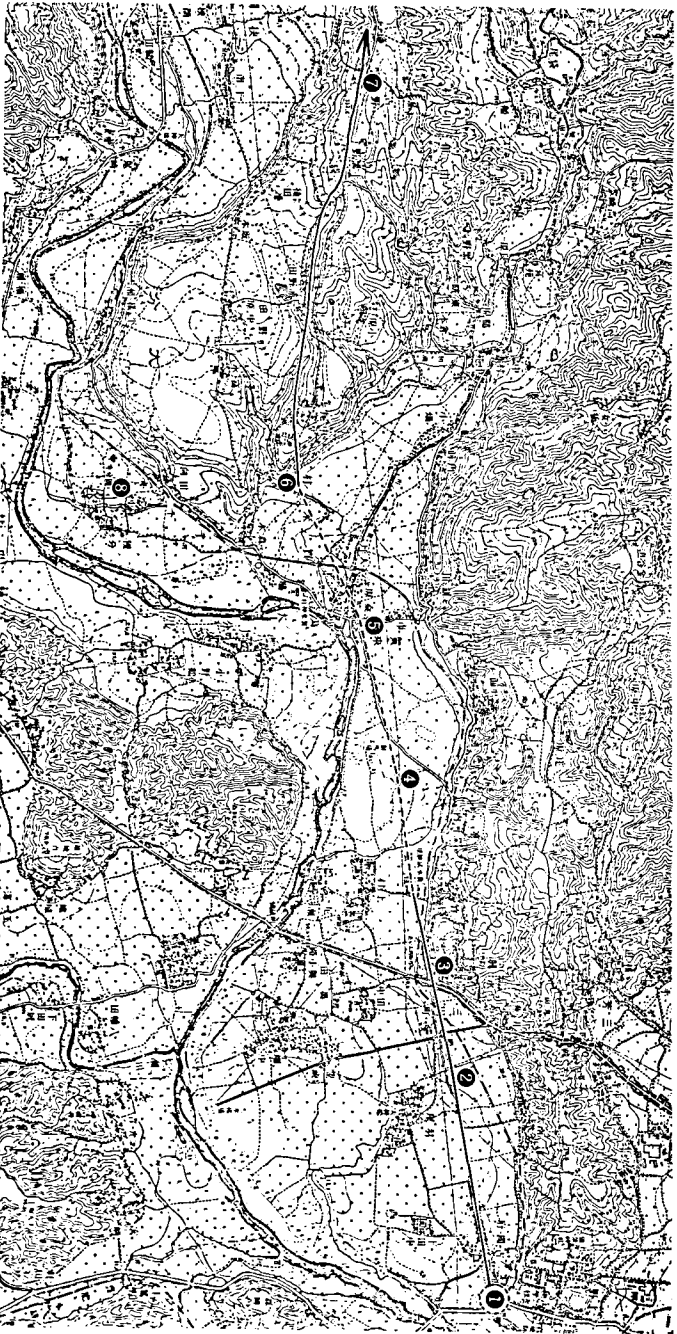
①高坂駅推定地 ②江戸初期の絵図に記されている「繩手道」 ③永興寺跡 ④荏隈の小字「車木」 ⑤賀来の小字「車木」 ⑥大明神社 ⑦換間町古野 ⑧豊後国分寺跡 *実線部分は現在(近年)でも道もしくは地割が存在し、 破線部分は推定である。