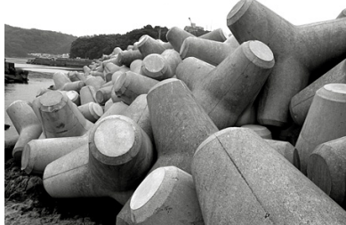
図 1: 消波ブロック

本稿では、多数の消波ブロックの配置を確認するために、単一の消波ブロックの3次元姿勢を推定する手法について述べる。得られる形状は3次元点の集合であり、既知の消波ブロック形状のCADモデルを当てはめる必要がある(図2参照)。そこで、ここでは従来用いられているICP法を改良し、さらにGPUを用いて処理を高速化する手法について述べる。