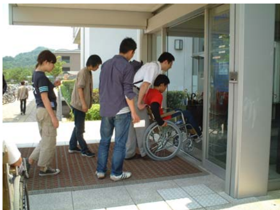
図1 車いす講習会の様子