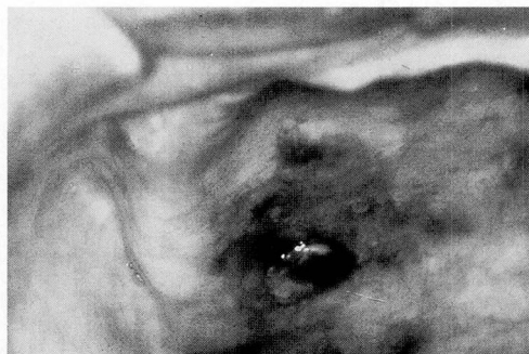
写真2 右側硬口蓋に発生した褐色の腫瘍

現 症：右側硬口蓋に、0.7 cm 径大の有茎性で弾性軟、表面褐色調の比較的平滑な腫瘍を認めるようになった（写真2）。周囲の異常硬結等はなかった。その後、腫瘍は急速に増大して約2 cm 径大になり、辺縁は一部壊死をきたした。