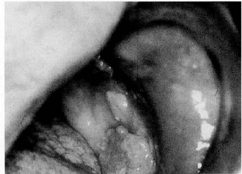
写真1 上・下顎に発生した疣贅癌の肉眼所見 (上段：PM部，下段：M部)